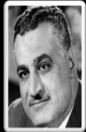
गमाल अब्दुल नासिर -मिस्र

ने बांडुंग में एक सफल बैठक की, जिससे गुटनिरपेक्ष आन्दोलन की विचारधारा का उदय हुआ ।