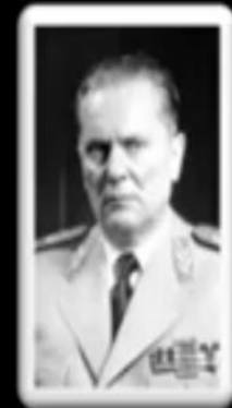
जोसेफ ब्रांज टीटो -युगोस्लवीया