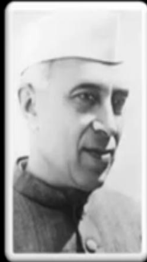
जवाहर लाल नेहरू - भारत