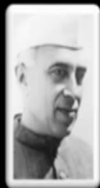
आहर लाल नेहरू - भारत

☞ पहला सम्मेलन 1961 में बेलग्रेड में हुआ