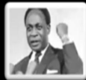
एनक्रुमा - घाना