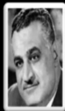
गमाल अब्दुल नासिर -मिस्र