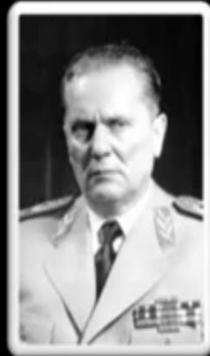
जोसेफ ब्रांज टीटो -युगोस्लवीया